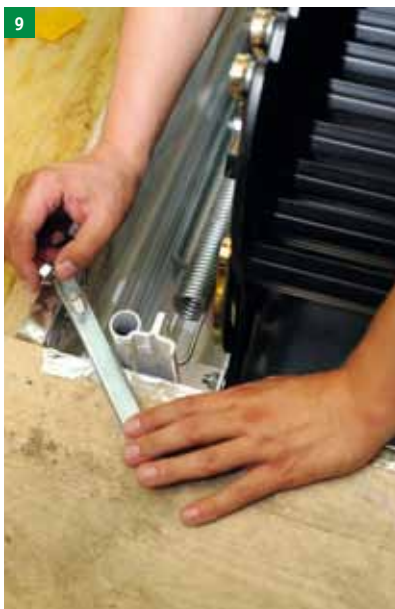
9 V zgornjem prostoru naj tretja oseba vstavi vijak v odprtine nosilcev okvirja