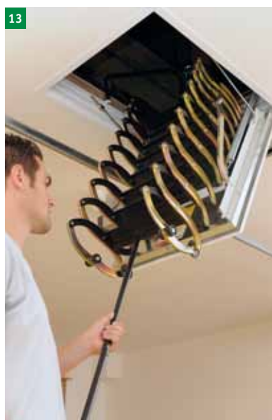
13 Odprite vrata