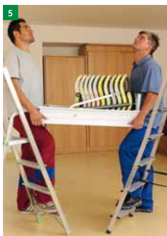
5 Dve osebi naj dvigneta stopnice