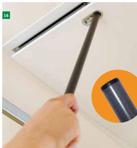
16 S plastičnim čepom na drugem koncu palice potisnite zapiralo vrat