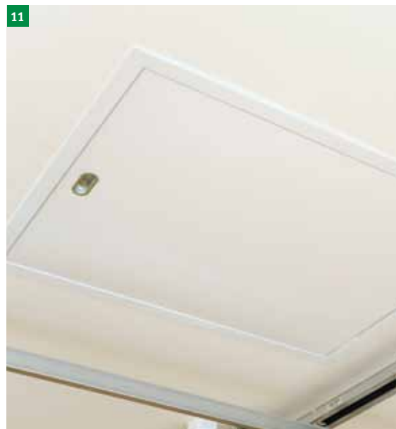
11 Čvrsto privijte še ostale vijake