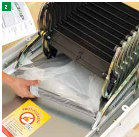
2 Odprite vrečko s pritrdilnim materialom