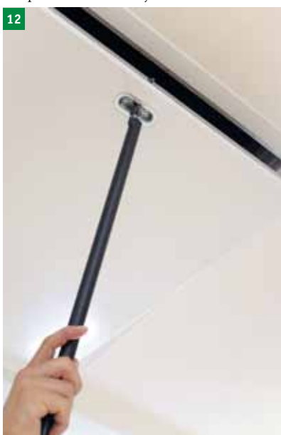
12 Vstavite kljuko odpiralne palice v zanko na vratih stopnic