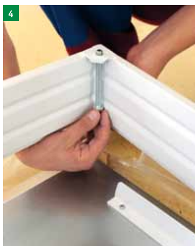
4 Vstavite 4 kotne vijake