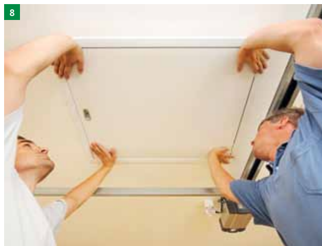
8 Nastavite stopnice v pravičen položaj