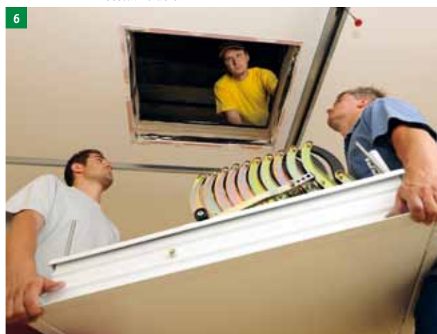
6 Tretja oseba naj bo v zgornjem nadstropju, s potrebnim orodjem