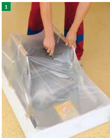
1 Odstranite embalažo