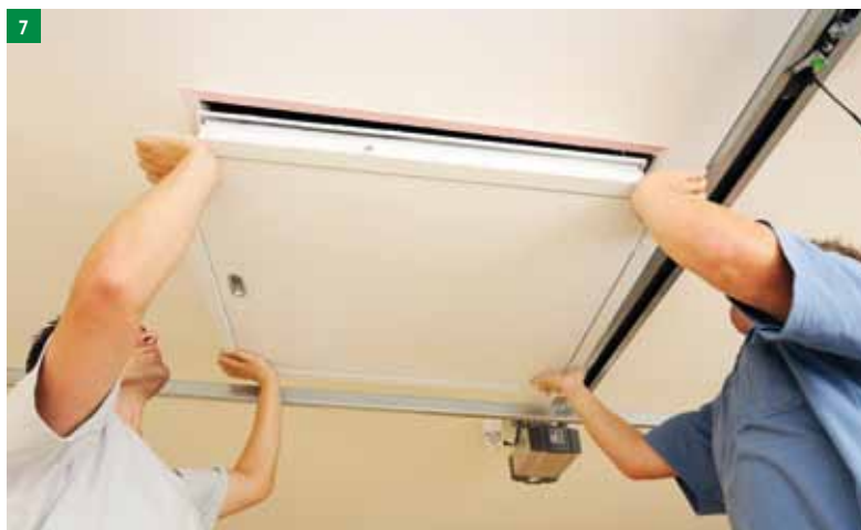
7 Stopnice vstavite v gradbeno odprtino