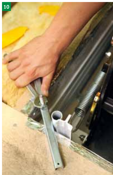
10 Privijte matico na nosilem vijaku