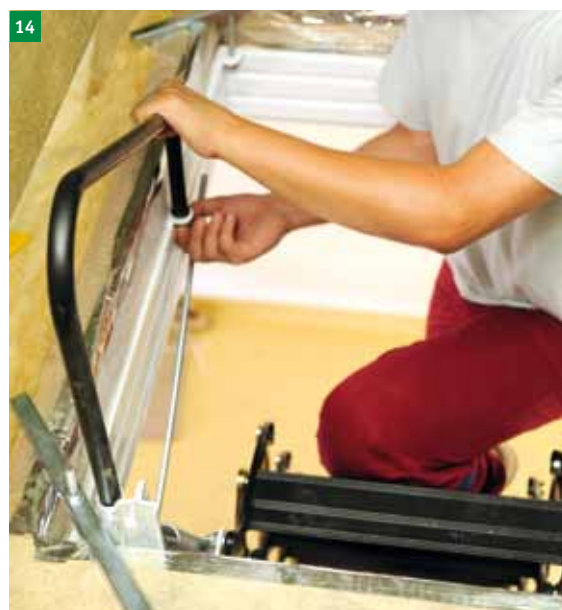
14 Pritrdite varovalno ograjo